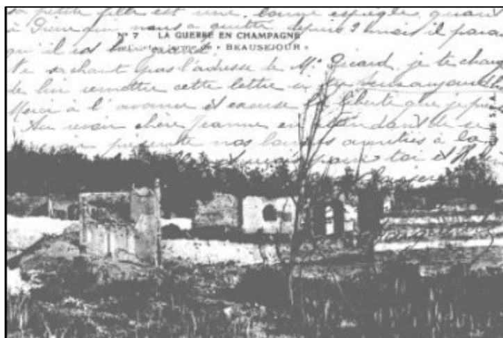
Ferme de Beauséjour en ruines

Depuis le 13 mars, les compagnies du 142 e RI s'élancent à l'assaut des tranchées ennemies. À mi-chemin de la route de Massiges à Mesnil-lès-Hurlus, sur le coteau, s'accrochent les ruines de la ferme de Beauséjour. Sur le plateau, un labyrinthe inextricable de tranchées et de boyaux est âprement disputé, c'est le fortin de Beauséjour. Les assauts provoquent de farouches combats corps à corps, mais les positions restent inchangées. Beaucoup de morts pour rien... !